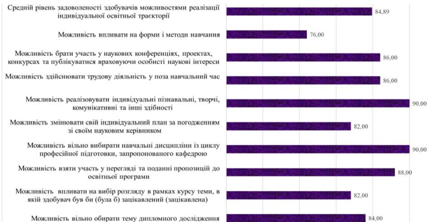
Рис. 1. Дослідження рівня задоволеності здобувачів можливостями реалізації індивідуальної освітньої траєкторії