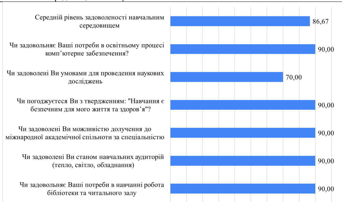
Рис. 2. Дослідження рівня задоволеності здобувачі навчальним середовищем та матеріально-технічною базою, %

Серед проблем, що виникали із долученням до міжнародної академічної спільноти, було названо високу вартість публікацій та участі у міжнародних програмах, конференціях.