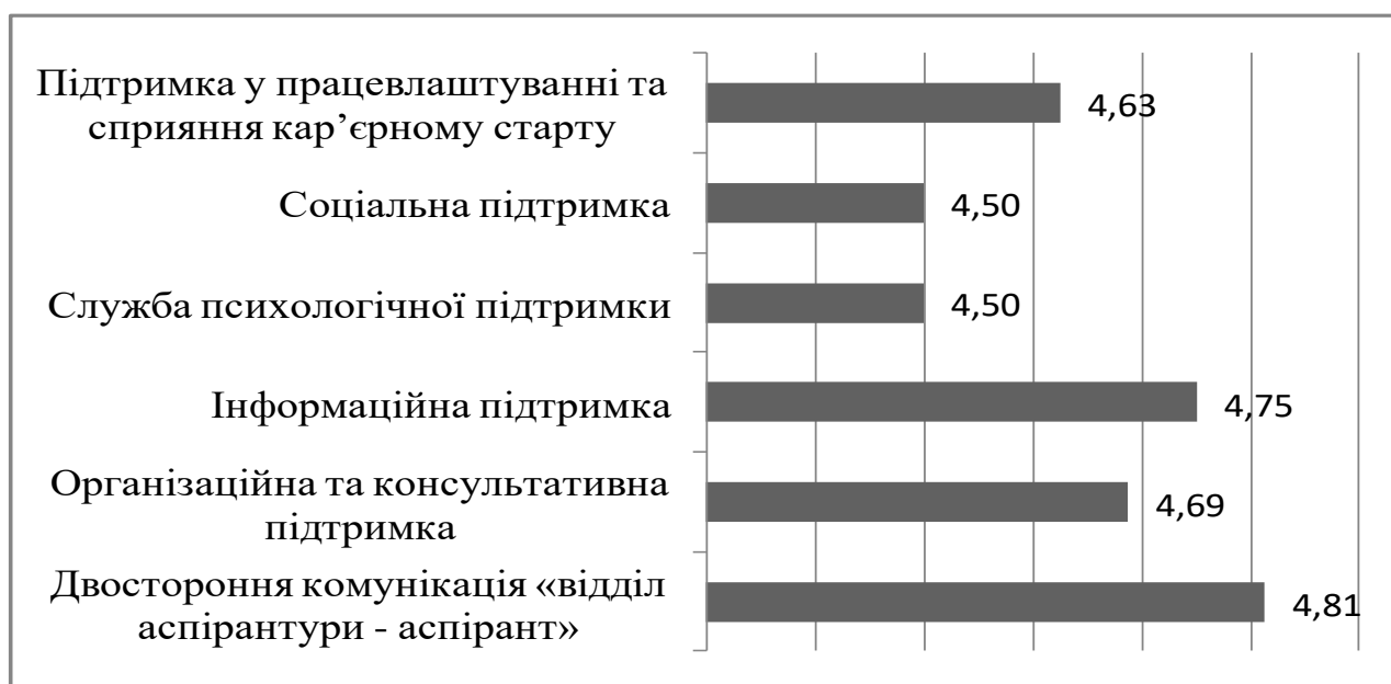
Рис 1. Оцінка здобувачами вищої освіти ефективності існуючих у Національному університеті «Львівська політехніка» механізмів підтримки, середній бал за 5-ти бальною шкалою.

Ті ж аспіранти, які коли-небудь зверталися про допомогу або володіють інформацією щодо наявних механізмів підтримки в університеті вважають їх скоріше ефективними середній бал становить 4,65.