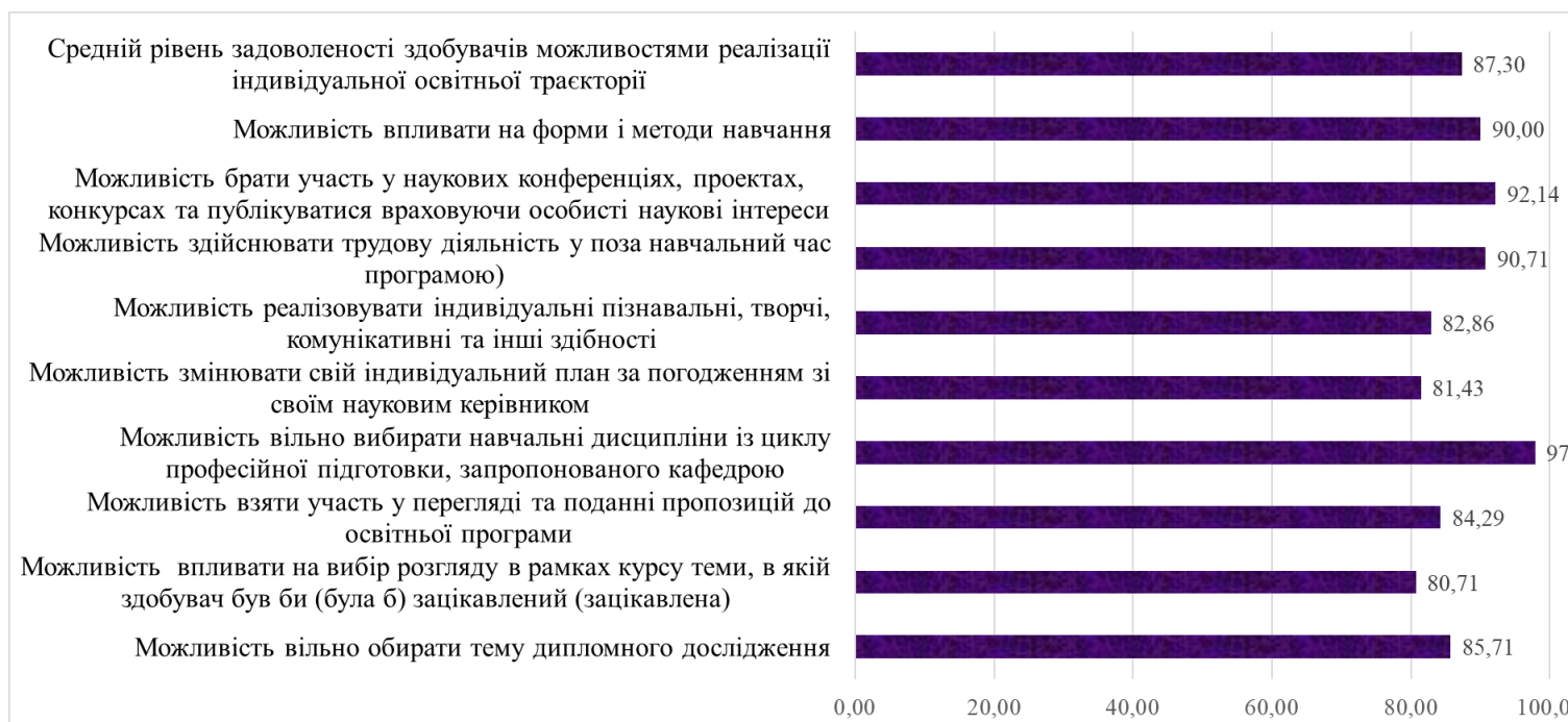
Рис. 1. Дослідження рівня задоволеності здобувачів можливостями реалізації індивідуальної освітньої траєкторії