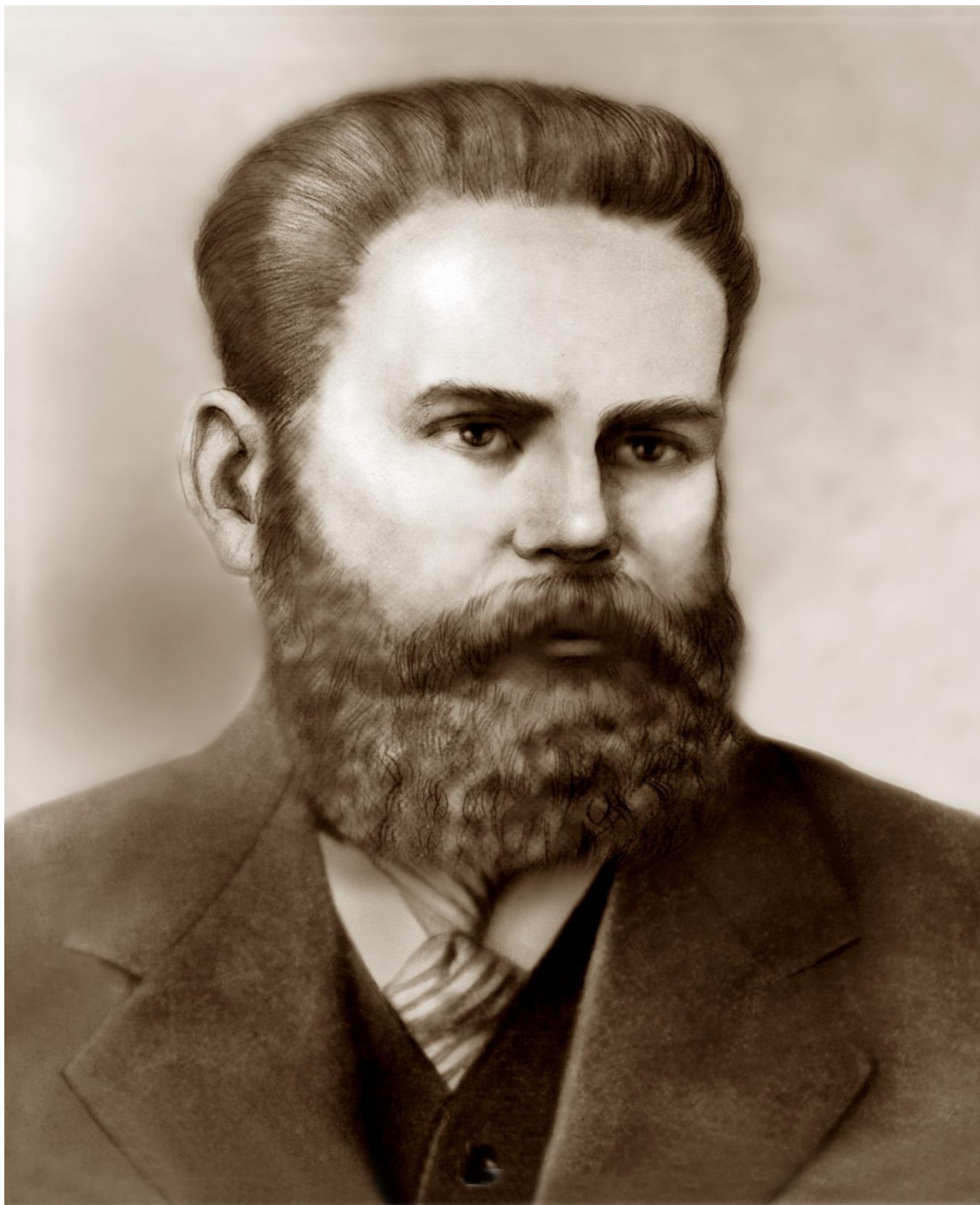
Микола Миколайович Бенардос