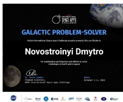
Рис.2 Сертифікат учасника хакатону

Під час безперервної роботи над проєктом учасники мають змогу поспілкуватися з менторами та поринути у неймовірну атмосферу форуму.