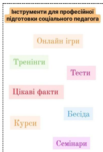
Рис. 1. Інструменти професійної підготовки майбутніх соціальних педагогів до соціально-педагогічного консультування в умовах дистанційної освіти

Задля ефективної підготовки майбутніх соціальних педагогів до соціально-педагогічного консультування учасників освітнього процесу, на наш погляд, доцільно організовувати в процесі дистанційного навчання студентів за фахом: професійні тренінги; психолого-педагогічні ігри та вправи онлайн; імітаційні ігри; професійне тестування; участь в онлайн курсах професійного спрямування; круглі столи, семінари, інтерактивні бесіди з обговоренням цікавих фактів та міні-конференції; опанування сучасним ІКТ, розвиток медіа грамотності тощо (Рис. 1).