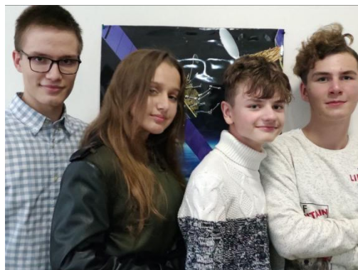
Рис.1 Команда MARSIK1

Серед учасників два роки поспіль є команда MARSIK1 – студенти коледжу спеціальності «Інженерія програмного забезпечення», які демонструють навички групової роботи, створюючи проєкт.